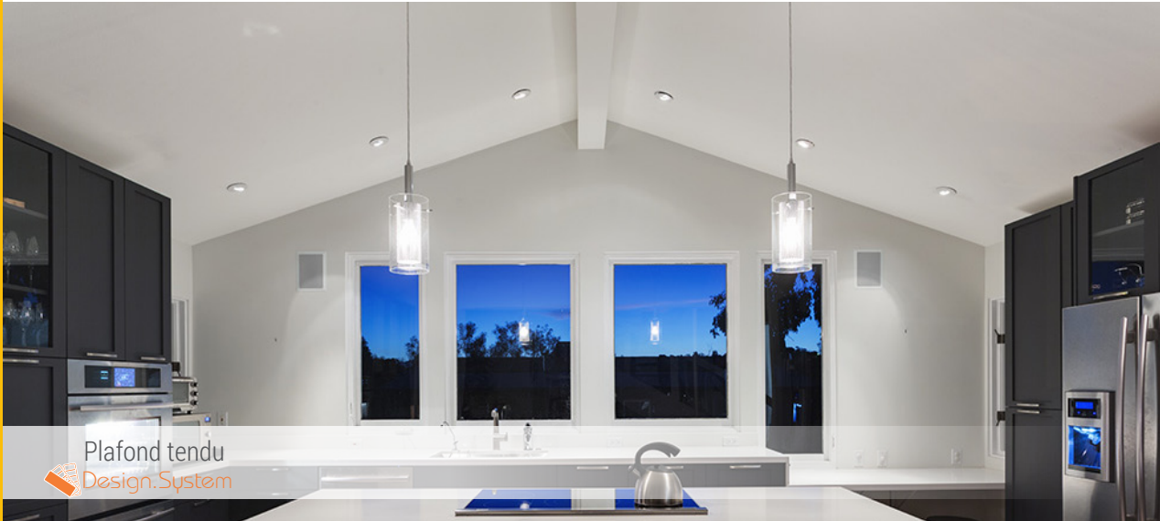
Plafond tendu Design.System